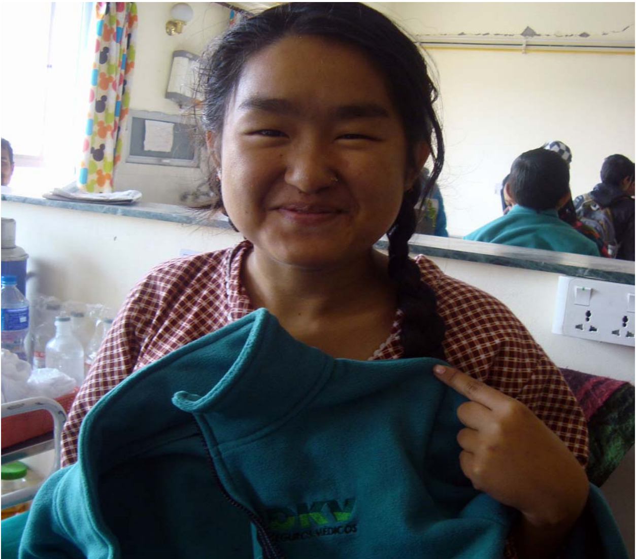
Escuela para niños ciegos en Tírsuli