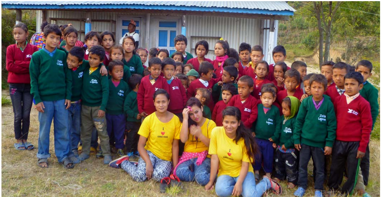
Y en la escuela de Jarshingpouwa